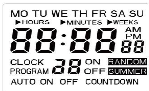
obr. 1 LCD displej